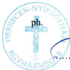
Palánki Ferenc megyéspüspök